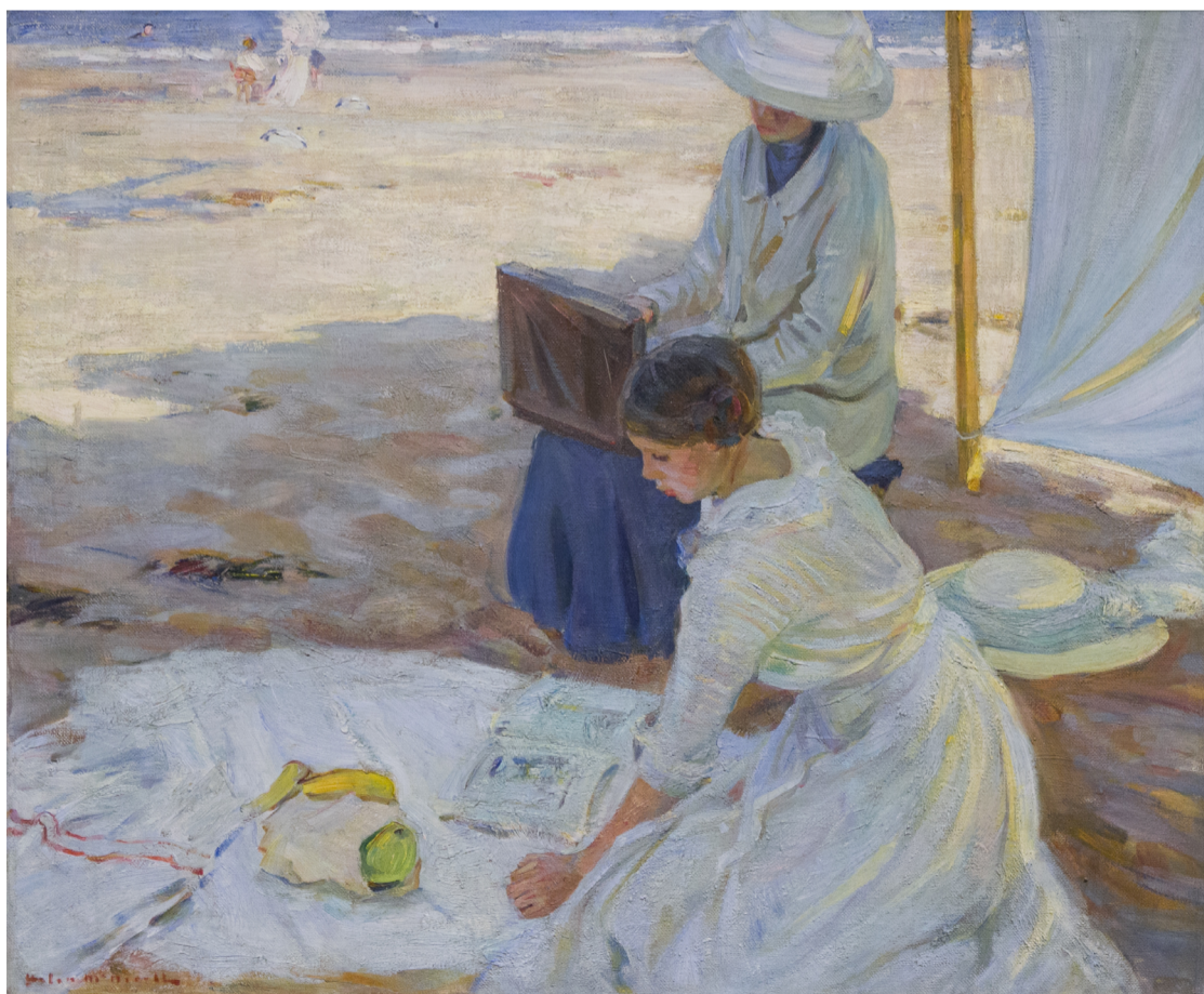
Helen McNicoll, À l'ombre de la tente , 1914 Huile sur toile, 83,5 x 101,2 cm. Montréal, Musée des beaux-arts de Montréal.

Modération : Sandrine Ferré-Rode (Université Versailles-Saint-Quentin-en- Yvelines, Institut d'études culturelles et internationales)